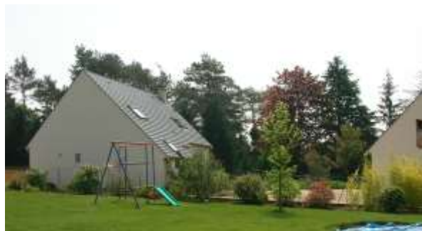
la maison de la Permanente Responsable face aux studios